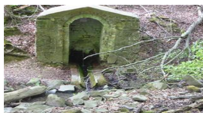
Kontrollstelle Heistenbach Trinkwasser

Mit besten Grüßen und bleiben Sie gesund!